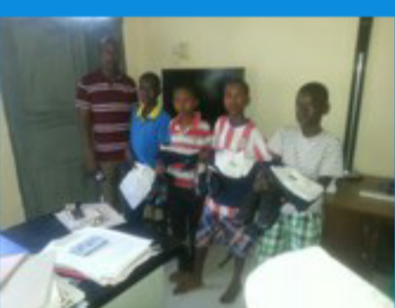
Vier jongens krijgen hun schoolspullen en gaan weer in hun eigen (pleeg) gezin wonen. SPANNEND!!!