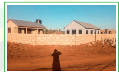
het kantoor en de toiletten worden naast de social hall gebouwd