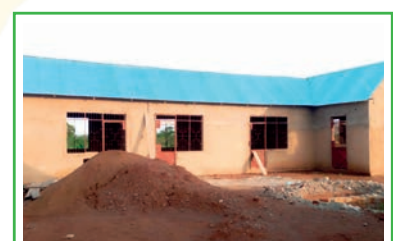
4 klaslokalen naast de social hall