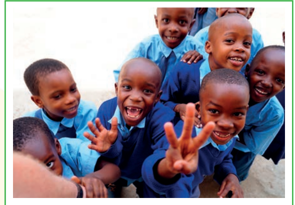
Gelukkig en gezond opgroeien in Tanzania

In Tanzania kunnen we (nog) niet terugvallen op een overheidssysteem voor jeugdhulp of kindbescherming. Om goed voor kinderen te zorgen, zien we het belang van een goede samenwerking tussen onze lokale partners en de lokale overheid.