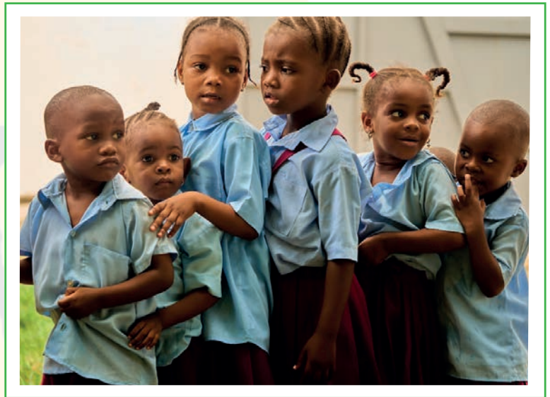
kleuter en peuters op Smile Academy

Het effect van de schoolgang op het leven van deze jonge kinderen is groot. Het dagritme, de dagelijkse voeding, het onderwijs en het spelen: het heeft allemaal een positief effect gehad op hun lichamelijke groei en hun sociaal, emotionele en cognitieve ontwikkeling.